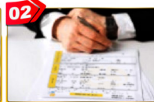
02 فرم های مورد نظر را پر کنید