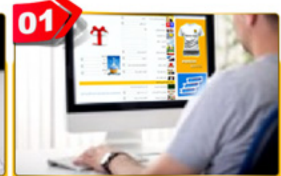
01 بیمه خود را آنلاین سفارش دهید