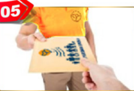
05 به رایگان برایتان ارسال می گردد