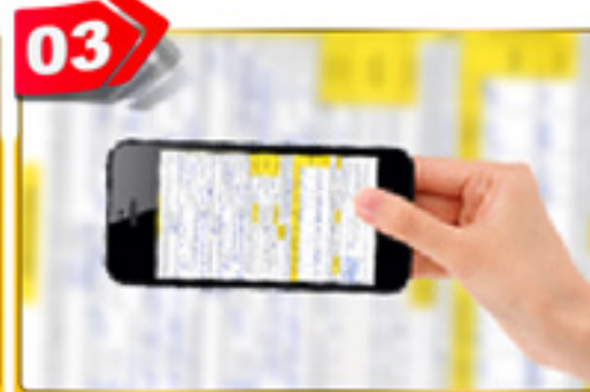
03 با موبایل عکس گرفته و ارسال کنید